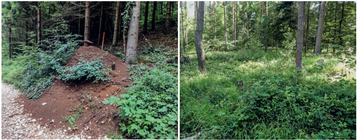
Abb 1 Ein solch grosses Nest direkt am Wegrand wie im linken Bild wird unmöglich übersehen. Dagegen wird das kleine, durch Vegetation überdeckte Nest im rechten Bild nur bei genauem Hinschauen entdeckt (das Nest befindet sich beim roten Markierungspfahl).

Grossbritannien (Procter et al 2015). Eine schweizweite Habitatstudie der Waldameisen wurde ausserdem von Vandegehuchte et al (2017) durchgeführt.